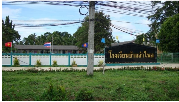
วัดและโรงเรียนที่ได้รับประโยชน์จากการขุดลอกแก้มลิง