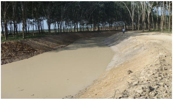
โครงการแก้มลิงพรเตียว

แผนที่แสดงที่ตั้งโครงการ/แผนที่ 1 : 50,000