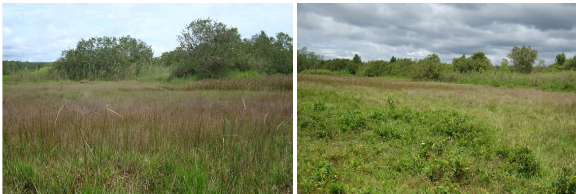
บริเวณพื้นที่ที่จะดำเนินการขุดลอกเพื่อทำแก้มลิง

สามารถบรรเทาปัญหาน้ำท่วมในเขตพื้นที่ตำบลลำไพล อำเภอเทพา จังหวัดสงขลา ได้ส่วนหนึ่ง และเป็นแหล่งน้ำสำหรับกักเก็บน้ำเพื่อการอุปโภคบริโภค ทั้งในฤดูฝนและฤดูแล้ง นอกจากนี้ยังเป็นแหล่งท่องเที่ยวพักผ่อนหย่อนใจในท้องถิ่นและเป็นแหล่งเพาะพันธุ์สัตว์น้ำจืด อีกด้วย