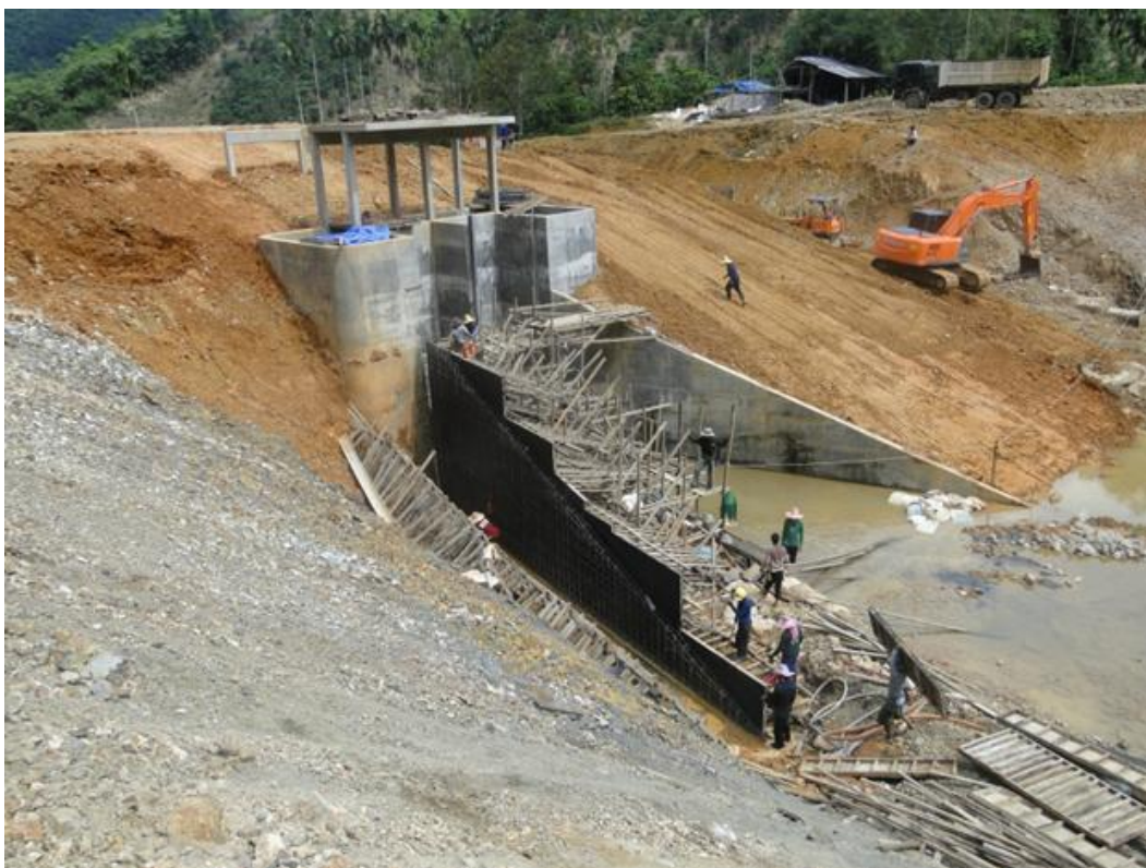
อาคารอัดน้ำบ้านห้วยไทรงาม เป็นอาคารอัดน้ำชนิดท่อสี่เหลี่ยม จำนวน 2 ช่อง ขนาดกว้าง 2.50x2.50 เมตร ความยาว 37.50 เมตร

ทั้งนี้ จะสามารถส่งน้ำสนับสนุนการอุปโภคบริโภคของราษฎรหมู่ที่ 10 บ้านห้วยไทรงาม จำนวน 180 ครัวเรือน 600 คน และพื้นที่การเกษตร 325 ไร่ ได้อย่างเพียงพอตลอดทั้งปี ซึ่งจะส่งผลให้ราษฎรมีรายได้คุณภาพชีวิตและความเป็นอยู่ที่ดีขึ้นตามลำดับ