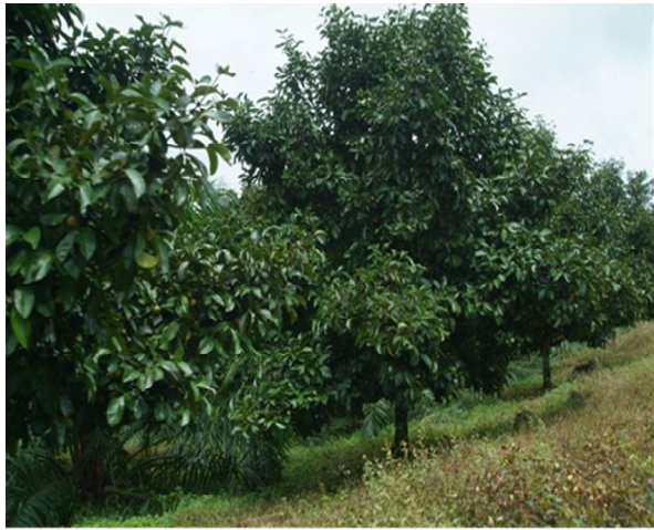
ราษฎรบ้านทุ่งคา หมู่ที่ 1,2 และพื้นที่ใกล้เคียงประมาณ 110 ครัวเรือน 300 คน และพื้นที่การเกษตร จำนวน 1,200 ไร่ ที่ได้รับประโยชน์จากโครงการ