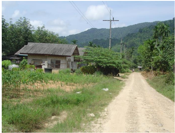
พื้นที่การเกษตรประมาณ 1,200 ไร่ และบ้านเรือนราษฎร จำนวน 100 ครัวเรือน 400 คน ที่ได้รับประโยชน์