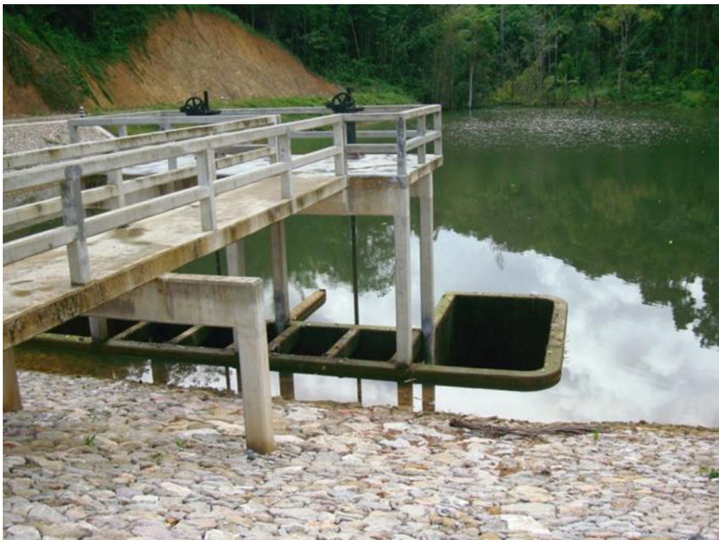
อาคารอัดน้ำคลองวังยวน ขนาด 2.50 x 2.50 เมตร จำนวน 2 ช่อง ความยาว 63.00 เมตร

ทั้งนี้ จะสามารถส่งน้ำช่วยเหลือราษฎรบ้านหินขาว หมู่ที่ 9 ตำบลกะเปอร์ อำเภอกะเปอร์ จังหวัดระนอง จำนวน 100 ครัวเรือน 400 คน และพื้นที่การเกษตร จำนวน 1,200 ไร่ในฤดูฝน และ จำนวน 200 ไร่ในฤดูแล้ง ให้มีน้ำใช้อย่างเพียงพอตลอดทั้งปี