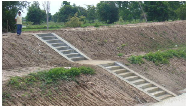
งานขุดลอกหนองหว้าที่ดำเนินการแล้วเสร็จ สามารถเก็บกักน้ำได้ ๕๐,๐๐๐ ลูกบาศก์เมตร